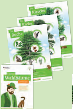
Die Posterserie „Unsere Waldbäume“ und das Begleitheft mit Hintergrundinformationen.