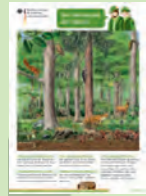
Das Poster „Stockwerke des Waldes“.